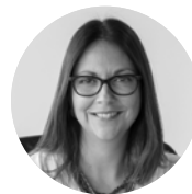
Natalia Piergentili Domenech Subsecretaria de Economía y EMT

De aquello surge el objetivo de nuestro Ministerio, en conjunto con BID, de impulsar el Proyecto Promociona Chile promovido por +Mujeres y la CPC, inspirado en el Proyecto Promociona en España, impulsado por el Ministerio de Sanidad, Servicios Sociales e Igualdad y la Confederación Española de Organizaciones Empresariales (CEOE)”.