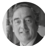
Juan Rosell Lastortas Presidente CEOE

Los éxitos del Proyecto nos han llevado a lanzar la quinta edición en nuestro país y es un orgullo para CEOE poner en marcha el Proyecto Promociona Chile junto con la CPC y el apoyo institucional de los Gobiernos chileno y español, de cara a conseguir que más mujeres y empresas se sumen a esta iniciativa que es ya una realidad global”.